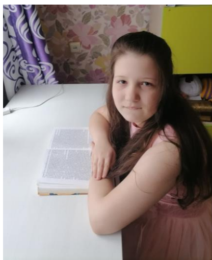
Фото 1. – Я люблю читать книги