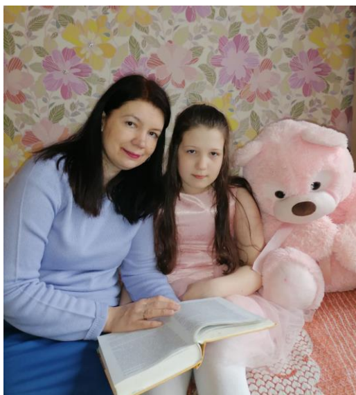
Фото 2.1. — Обсуждение прочитанного

В кратком литературном словаре для учащихся начальной школы сказано следующее. Тема — это круг проблем, жизненных явлений, на которых сосредоточил своё внимание автор литературного произведения. Сюжет — это цепочка действий в книге, то, в какой последовательности автор рассказывает о событиях. Художественный образ — любое явление, герой, которые рисуются автором в произведении. Проблема — это вопрос, который ставит в произведении автор. [6]