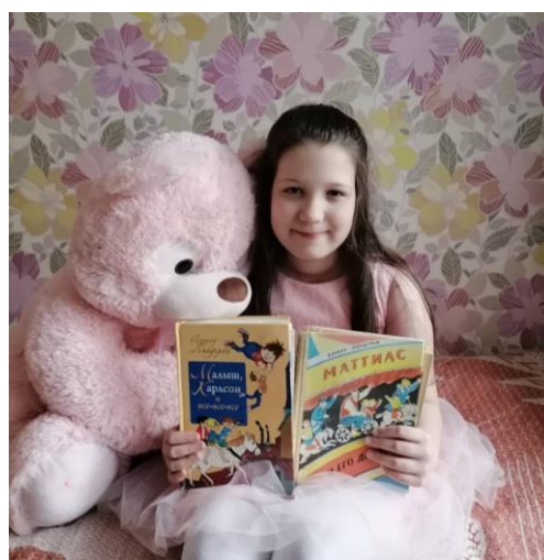
Фото 2. – Эти произведения перечитывала много раз

С тех пор как впервые прочитала эти произведения, задаю себе вопрос: Барбру и Астрид Линдгрен – это один автор, выступающий под псевдонимом и настоящим именем, или разные? Если разные, то родственники они или однофамильцы? Были ли знакомы они в жизни, что их объединяет?