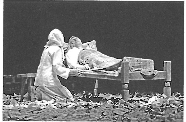
Сцэна са спектакля рэжысёра М. Пінігіна