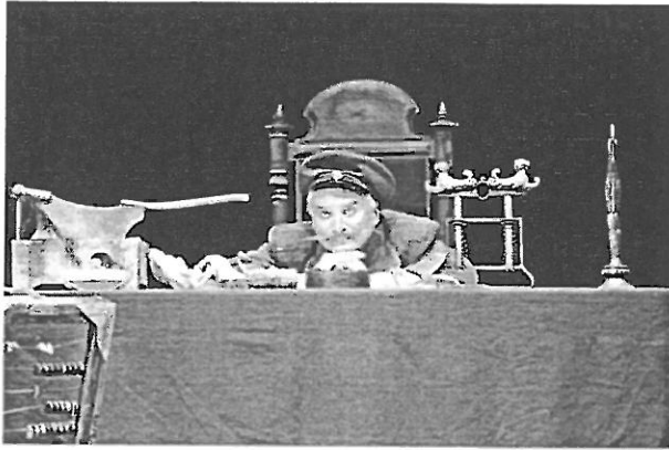
Сцэна са спектакля рэжысёра В. Раеўскага